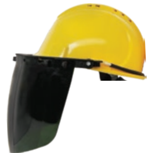
YS-53 + YS-55-G