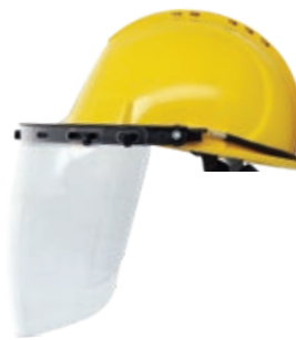
YS-53 + YS-55-C