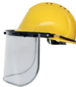
YS-53 + YS-54-C